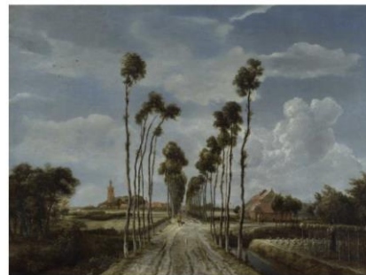
Аллея в Мидделхарнисе, Мейндерт Хоббема, 1681 год.

Задание 3. На рисунке отметьте линию горизонта и точку схода, а также линии перспективных сокращений предметов.